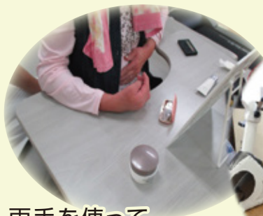
両手を使って 化粧をする練習