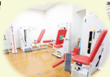
マシンで筋力向上