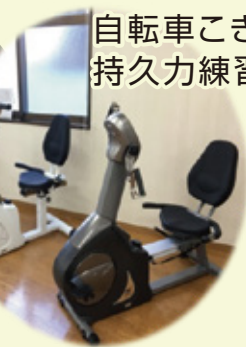
自転車こぎで 持久力練習